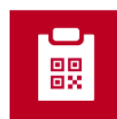
新型コロナウイルス接種証明書アプリ

Chỉ cần quét mã QR ,tải phần mềm ứng dụng . Đọc (quét) My number card Phiên bản iOS 13.7/Android 1.0.17